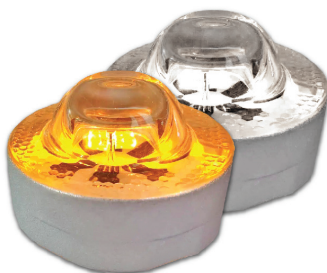
ไฟเลือกได้ 2 สี