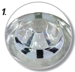
1. โคมกระจก ทำจากกระจกนิรภัย แข็งแรง ทนทาน