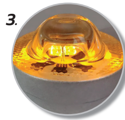
3. ไฟ LED 6 หลอด ทำงานอัตโนมัติในเวลากลางคืน